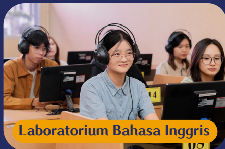
Laboratorium Bahasa Inggris