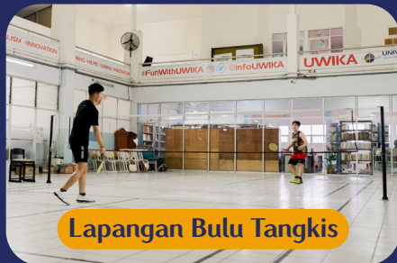
Lapangan Bulu Tangkis